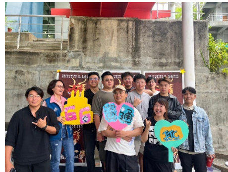
資通系-系友回娘家