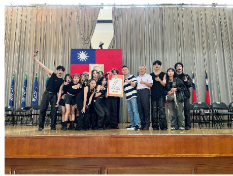
學生會-創意舞蹈競賽