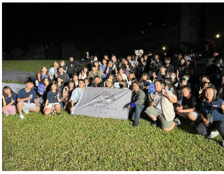
學生會-實踐之星決賽