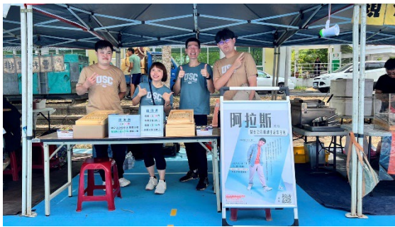
時尚系學會-糧辰集時-懷舊市集