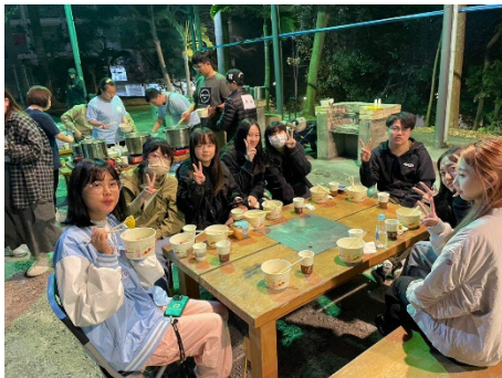
學生會-鍋來一起吃