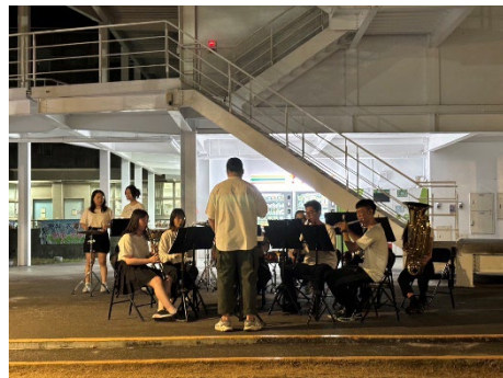
絮音管弦樂社-期初音樂會

5. 社團研習與輔導：舉辦社團輔導研習活動，建立標竿學習模式，加強學務與輔導工作觀摩、交流及傳承，並發展成為學習型組織；鼓勵學生參加校外研習會及活動觀摩學習，另成立FB、LINE社群以利資訊公告、事項宣導。