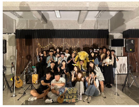
弦語吉他社-期末社大_你在吉什麼