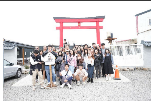
時尚系學會-春尚遊