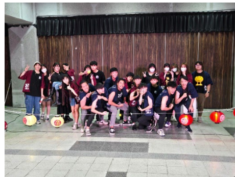
應日系學會-日文KTV唄祭り