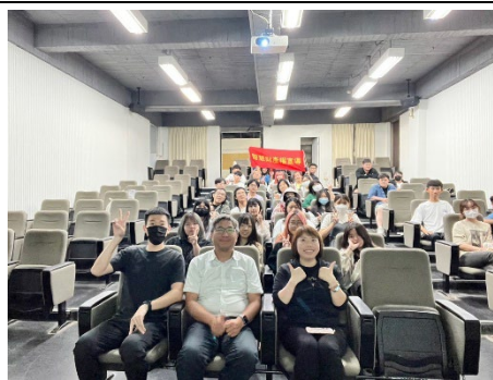
學生會-校園智慧財產權防身術