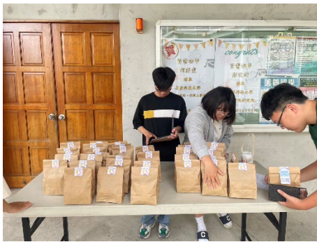
資管系學會-期中歐趴糖