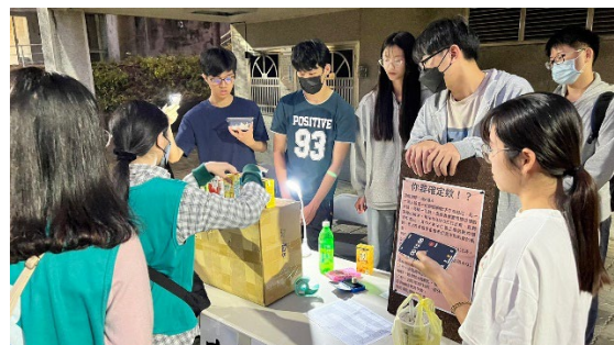
學生會-66週年校慶週活動-校園闖關