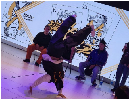
熱舞社-舞實。貳實 撲克之夜