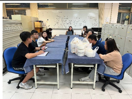
學生議會-4月議員大會