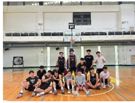
金管系學會-系對抗