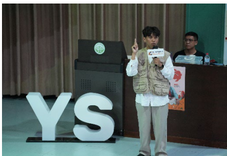
學生會-名人講座_阿拉斯_我的理想生活