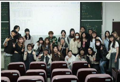
服經系學會-幹部交接暨送舊活動