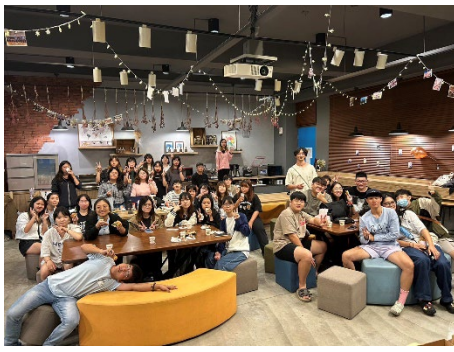
休產系學會-奏會來送舊