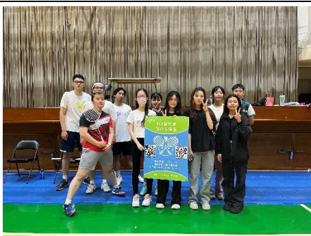
羽球社-112學年度羽球系際盃